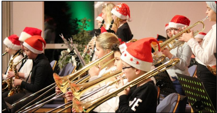
Das Foto zeigt die Bigbandklasse 6 während ihres Auftritts bei der Weihnachtsfeier des JAG im Jahre 2017

Der Unterricht gliedert sich in zwei Stunden Klassenunterricht bei dem Musiklehrer der Bigbandklasse und einer Stunde Instrumentalunterricht bei einer Lehrkraft der Musischen Akademie Emden. Das bedeutet gegenüber dem üblichen Stundenplan eine zusätzliche Unterrichtsstunde.