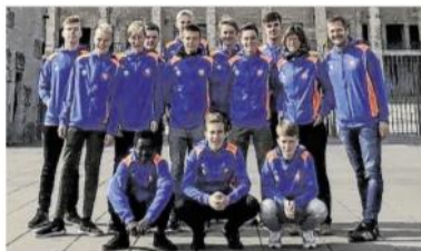
Die Leichtathleten des Johannes-Althausius-Gymnasiums Emden nahmen in Berlin am Bundesentscheid des Wettbewerbs „Jugend trainiert für Olympia“ teil und belegten einen tollen zwölften Platz. Nun gewannen sie die OZ-Sportlerwahl.

le mobilisiert: „Immer, wenn es sich ergab, haben wir die Sportlerwahl angesprochen.“